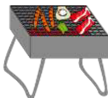
炭焼き・鉄板焼き